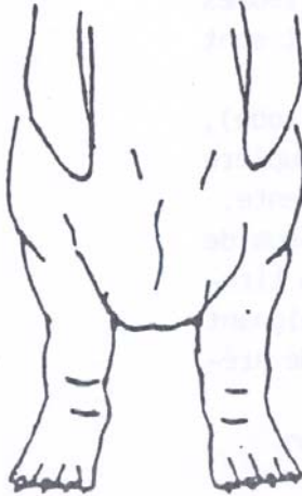
antérieurs demi-tors corrects